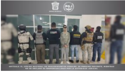
ARTICULO 18. CODIGO NACIONAL DE PROCEDIMIENTO PENAL. SE PRESUME INOCENTE. MIENTRAS NO SE DECLARE SU RESPONSABILIDAD POR LA AUTORIDAD JUDICIAL