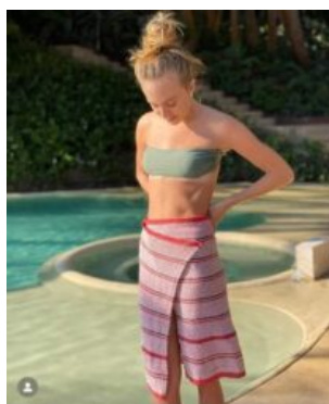
123 Me gusta cecilia.mexico Falda | tres cuartos | 📍 @palomagmzm