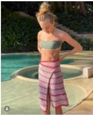
123 Me gusta cecilia.mexico Falda | tres cuartos | 📍 @palomagmzm